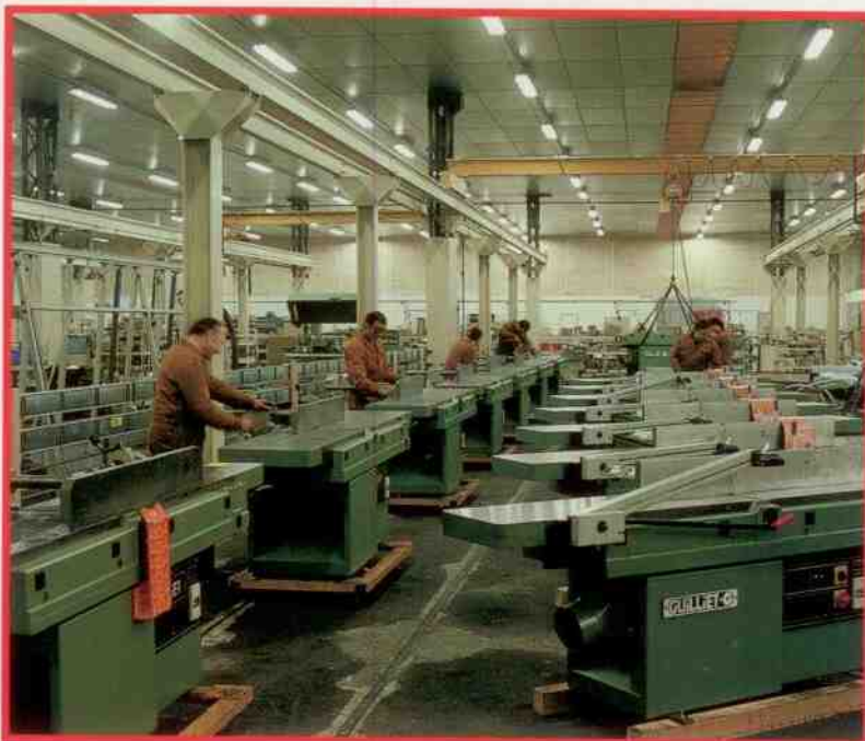
Ligne de montage